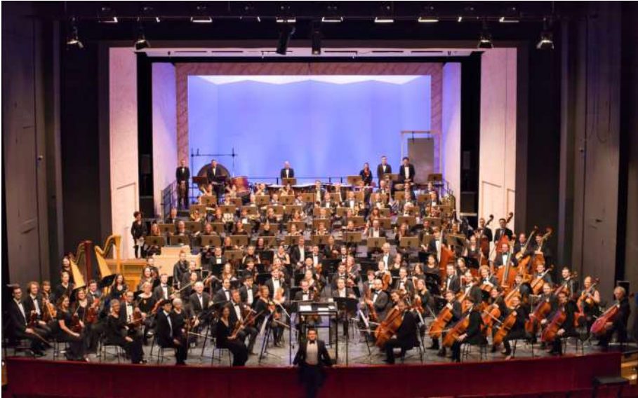
Das Sinfonieorchester des KIT bei der Alpensinfonie , Februar 2023