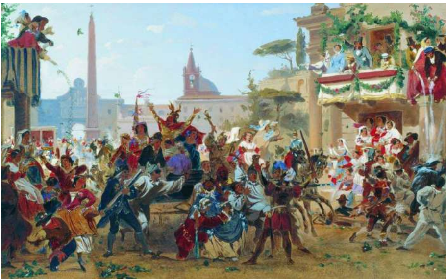
Fjodor Andrejewitsch Bronnikow, Carnevale a Piazza del Popolo (1860)

Bella ragazza fand neben einigen anderen Melodien Eingang in seine “italienische Fantasie”, die er später in Capriccio Italien umtaufte. Und so ist es auch ein lustvolles, im besten Sinne kapriziöses Potpourri von italienischen Gassenhauern in Form von Walzer, Galopp, Marsch und Tarantella – grandios eröffnet mit dem Zapfenstreich der italienischen Armee, den Tschaikowsky jeden Tag aus seinem Hotel hören konnte.