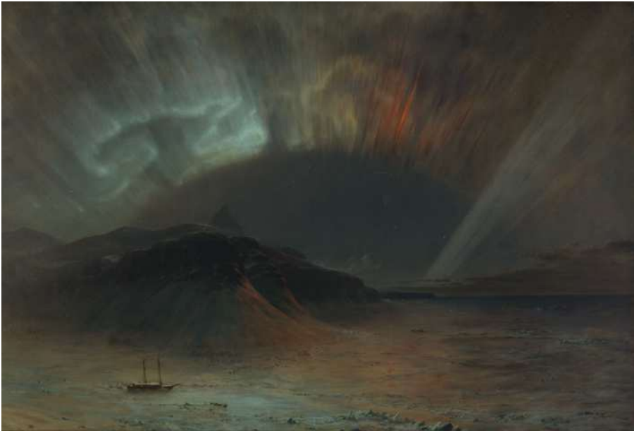
Frederic Edwin Church, Aurora Borealis (1865)