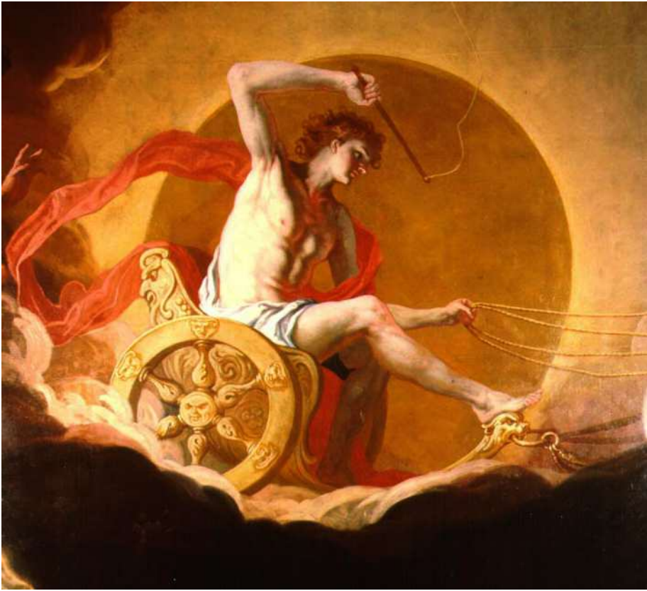
Ausschnitt aus: Hans Adam Weissenkircher, Helios in seinem Wagen (1678) Schloss Eggenberg, Planetensaal