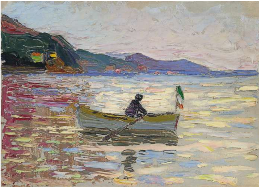
Wassily Kandinsky, Rapallo. Boot auf dem See (1906)

Das beginnt schon in den ersten Takten, wo sich eine Akkordfolge in wogendem Streicherklang nach oben hin auffächert – die Keimzelle fast aller