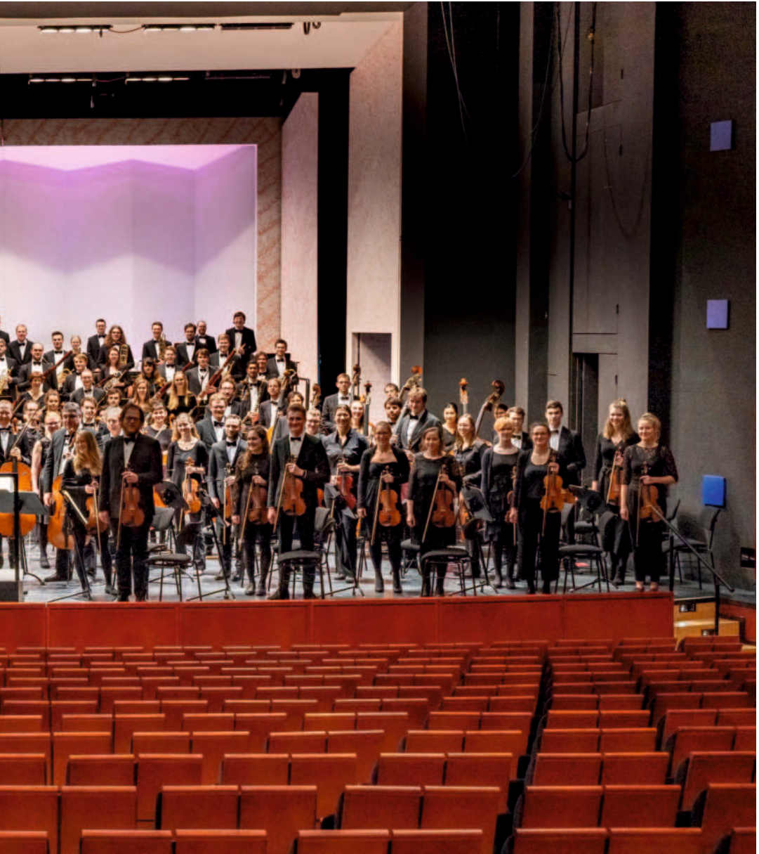
Sinfonieorchester des KIT, Konzerthaus Karlsruhe im Frühjahr 2020