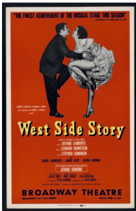
West Side Story, Broadway-Plakat (1958)