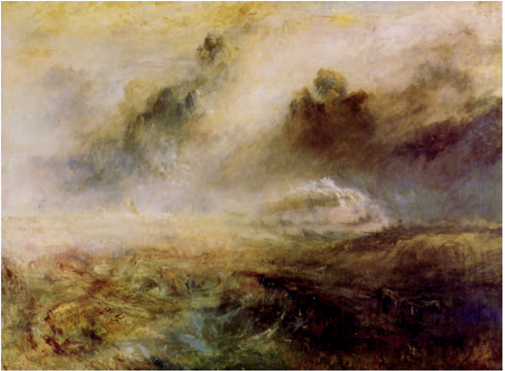
William Turner, Rough Sea with Wreckage (1840-45)

Das Finale inszeniert Debussy schließlich dramatisch: Im Dialogue du Vent et de la Mer ("Gespräch zwischen Wind und Meer") prallen zwei Naturgewalten aufeinander. Unter dem fernen Grollen des Schlagwerks kann man das Auftürmen von Wogen und die Macht der Windstöße erahnen, die sich ihnen entgegenstellen. Oboe und Flöte erzählen in ihren ausdrucksvollen Kantilenen vielleicht von Wehmut und Hoffnung, während sich unter ihnen das Wasser sanft bewegt oder eine brennende Sonne auf spiegelglatte See hinabstarrt; immer wieder werden sie