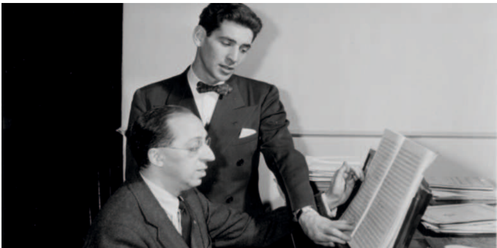
Aaron Copland und Leonard Bernstein (um 1940)

Tatsächlich hat Aaron Copland das US-amerikanische Musikleben und musikalische Selbstverständnis geprägt wie kein Zweiter. Seine Musik reflektiert US-amerikanische Traditionen und Werte, ohne sie zu glorifizieren, und sie lieferte mehreren Generationen US-amerikanischer Komponist*innen Ideen und Inspiration für eine individuelle Musiksprache. In mehreren Phasen seines Lebens wandte sich der Komponist mit großem Interesse dem